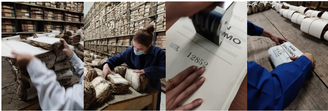
immatricolazione di 2.042 pacchi di bancali del Banco di San Giacomo e Vittoria dall'anno 1697 all'anno 1709

consentito la creazione negli anni passati di inventari analitici dettagliati e l'individuazione più rapida dei documenti richiesti dagli studiosi.